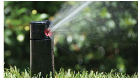
PGP Rote Düse

PGP-ADJ = 10 cm Versenkgrenner, einstellbarer Sektor PGP-ADJ-B-3,0 = 10 cm Versenkgrenner und blaue Düse Nr. 3,0 PGP-ADJ -07 = 10 cm Versenkgrenner, einstellbarer Sektor und rote Düse Nr. 7